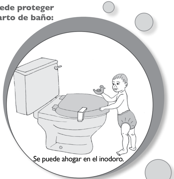
Se puede ahogar en el inodoro.

Carmen sabía que a Carlos le gusta jugar con agua y él trataría de entrar en el baño cuando ella no lo esté mirando. Carmen compró algunos artículos de seguridad que hacían más difícil que Carlos entre en apuros. ❖